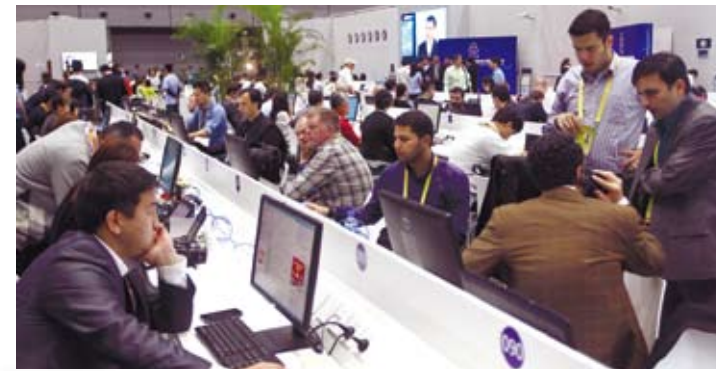
中外記者關注亞信峰會召開。圖為5月21日，中外記者在峰會新聞中心採訪的情景。

習近平最後表示，中國人民正在努力實現中華民族偉大復興的中國夢，同時願意支持和幫助亞洲各國人民實現各自美好夢想，同各方一道努力實現持久和平、共同發展的亞洲夢，為促進人類和平與發展的崇高事業作出新的更大的貢獻！