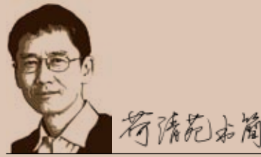
與台灣青年朋友的通信