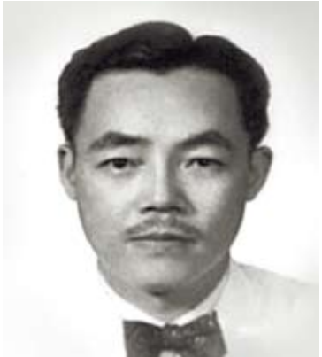
廖文毅是台灣知名人物，他曾說過台灣地位未定，主張由聯合國託管，以後自決。

日本的台獨勢力是最早發展的。1970年代以後，一些在日本的台獨人士轉進美國。同時，留美的台灣學生也多了。隨著國際局勢的變化，國民黨趕出聯合國，於是台獨勢力在美國蓬勃發展起來。這時，台灣已步入黨外時期，反蔣的鬥爭在海外又因「保釣」運動的發展而愈趨激烈。這是後話了。(待續)