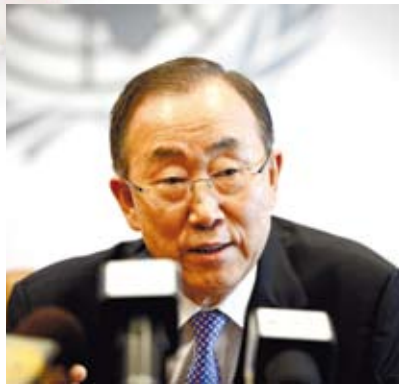
潘基文對亞信第四次峰會取得巨大成功充滿信心。圖為5月16日，聯合國秘書長潘基文在紐約聯合國總部接受中國大陸媒體聯合採訪。