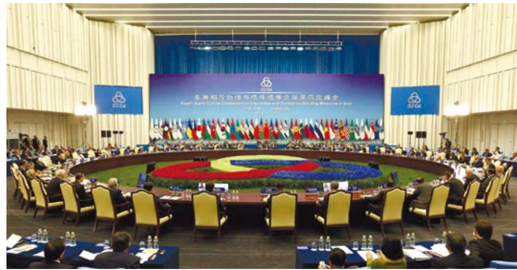
亞細亞相互合作與信任措施會議第四次峰會在上海舉行。